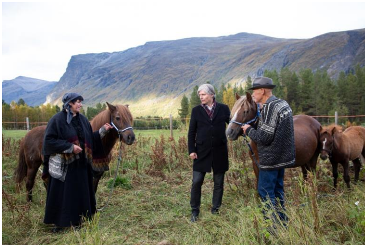
Fra Tørfoss under fredningsarrangement høst 2019, med daværende miljøminister Ola Elvestuen.