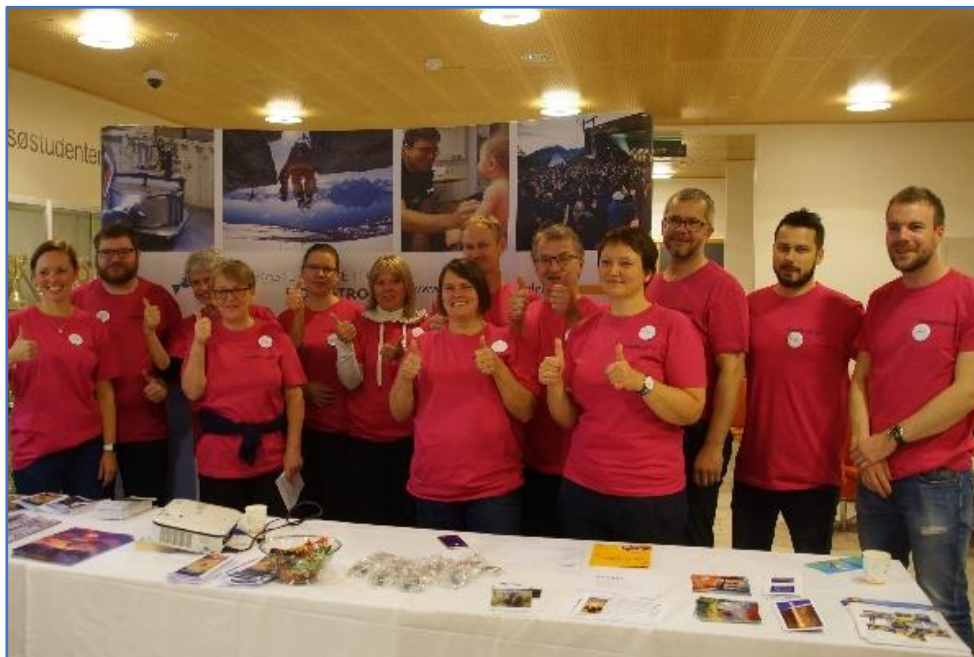
Arbeidslivsdagen på UiT – Nord-Troms-gjengen!