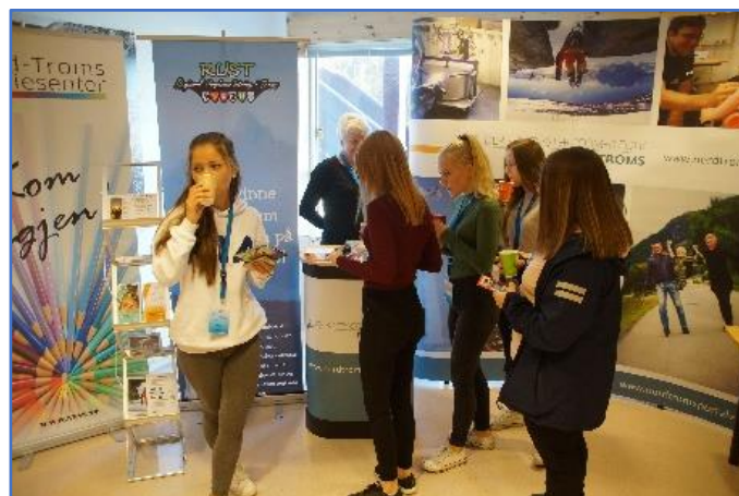
Nord-Troms-konferansen 28. september.