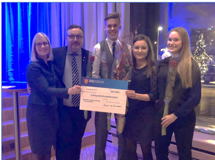
Ungdomssatsingen RUST mottar årets næringspris under Tromskonferansen.