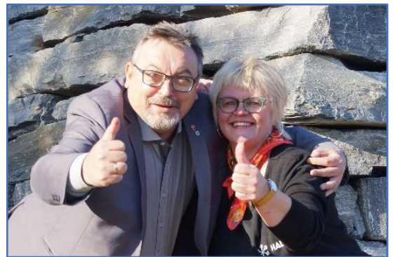
Politisk og administrativ leder av Regionrådet.

Den saken Regionrådet har hatt i fokus gjennom hele året, er Ny organisering av Nord-Troms-samarbeidet . Dette arbeidet startet opp på regionrådsmøte høsten 2016. Drøftingene i Regionrådets styre signaliserte et ønske om et sterkere politisk fokus (færre saker av administrativ karakter). Regionrådet kan ses på som arena for samskapt politikkutvikling på valgte politikkområder, f.eks. der det er viktig å ha en felles holdning utad for å stå sterkere. Drøfting av arbeidsformer for å styrke det politiske lederskapet og diskusjon om hvordan man kan komme i posisjon/være i forkant i de politiske prosessene har stått på agendaen i flere møter. Det har også vært diskutert hvordan man forankrer saker i kommunestyret i den enkelte kommune og hvordan man skaper legitimitet for arbeidet.