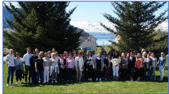
Temadag: «Barn som pårørende» 8. juni.

NTSS deltok på konferanse i Tromsø om digitalisering og velferdsteknologi 19. april samt Samhandlingskonferansen 28.–29. november.